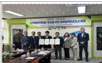
황남빵 계약재배 업무협약(군위)