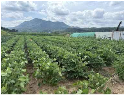
2025년 팥 시범단지 조성(대구 군위)

농촌진흥청(청장 이승돈) 국립식량과학원은 국산 팥 소비 활성화 및 자급률 증진을 위해 가공산업체와 '산업체 연계 지역특화 가공용 팥 원료곡 생산 기반 조성 시범사업'을 추진, 눈에 띄는 성과를 내고 있다.