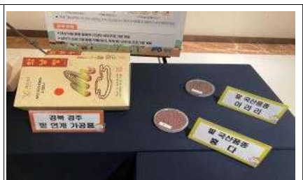
팥 연계 가공품(경주, 군위)