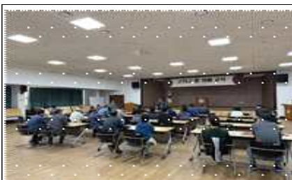
팥 재배기술 교육(군위)