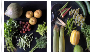
〈 식재료 꾸러미 〉