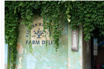
〈 식당·계절마켓 〉