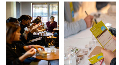
〈 미식교육 프로그램 〉