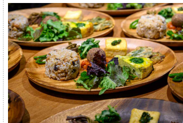
〈 제철채소 플레이트 〉