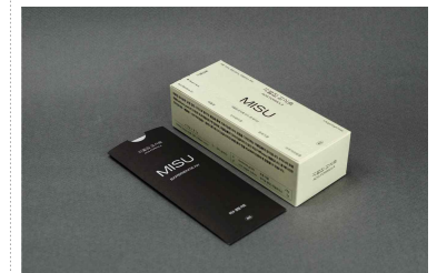
〈 미수 및 미수 경험키트 〉