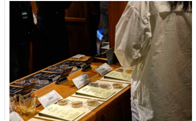
〈 토종곡물 카페·쇼룸 〉