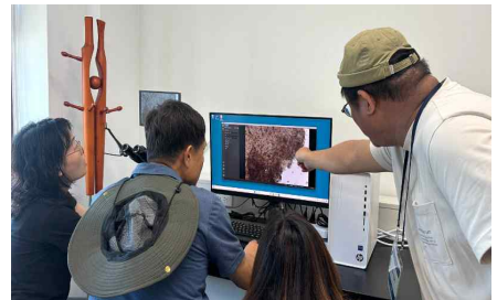
<버섯 육종 실습>

농촌진흥청(청장 이승돈)은 국내 버섯 산업의 경쟁력을 높이고 민간 버섯 육종가를 양성하기 위해 전문 단기 프로그램 '버섯사관학교'를 운영한다고 밝혔다.