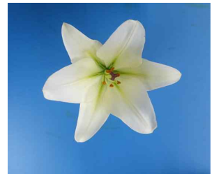
<나리 계통 '원교 C1-148'>

나리(백합)는 화사한 색감과 우아한 꽃 모양으로 사랑받는 대표적인 화훼작물이다. 흔히 꽃다발, 꽃꽂이 등으로 활용도가 높아 시장에서 꾸준히 관심을 받고 있다.